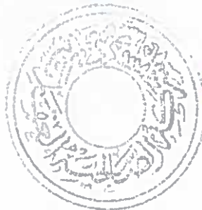
غازي فهد النفيسي رئيس مجلس الإدارة

هيئة أسواق المال: الكويت التاريخ: الوقت: المستلم: ١٠/١١/٢٠١٤